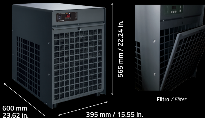
Filtro / Filter