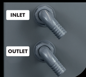
Giunti acqua / Water Joints