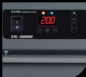
Termostato / Thermostat