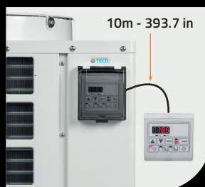
Controllo remoto / Remote Control