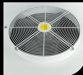
Ventola / Fan