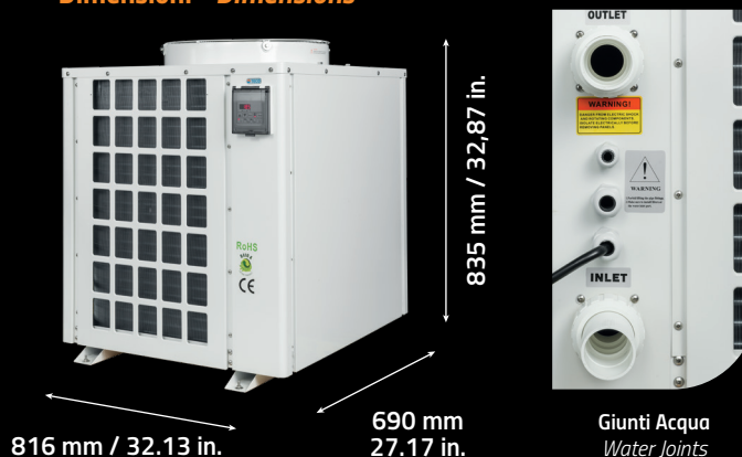
Giunti Acqua Water Joints